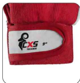
suchý zip na zápěstí Suchý zips na zápästí velcro cuff mankiet z rzepem