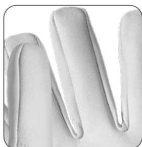
styl fourchette štyl fourchette fourchette style styl fourchette